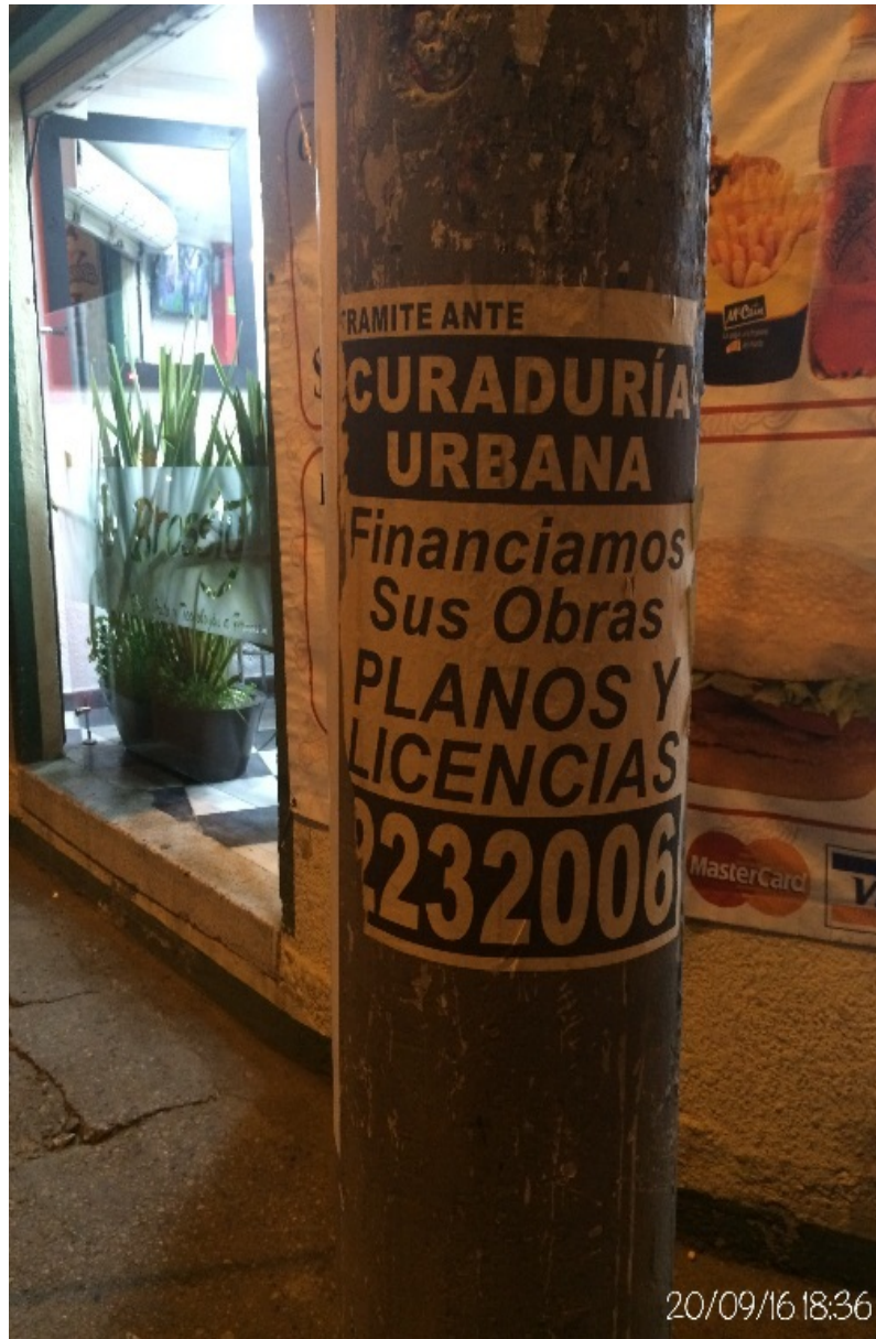
Fotografía No. 11, 12 y 13. Elementos instalados en Espacio Público (Mobiliario Urbano). Visita de oficio en la Localidad de Engativá, el día 20 de Septiembre de 2016. No. Afiches: 3.