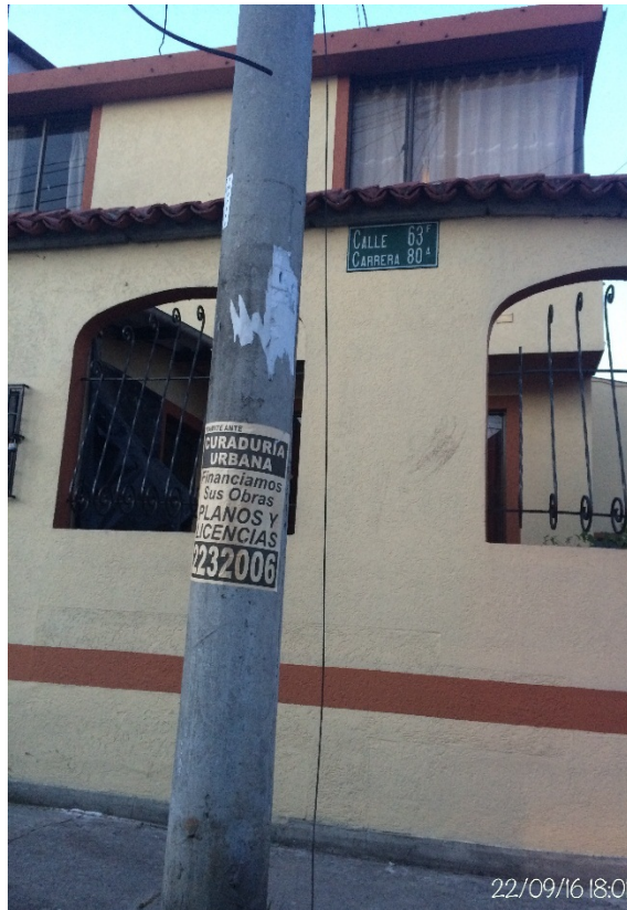
Fotografía No. 10. Elemento instalado en Espacio Público (Mobiliario Urbano). Visita de oficio en la Localidad de Engativá, el día 22 de Septiembre de 2016. No. Afiches: 1.