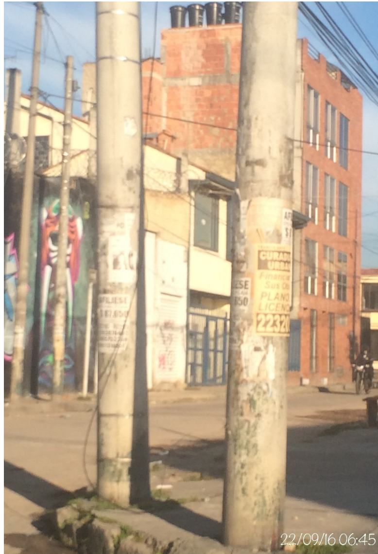
Fotografía No. 18. Elemento instalado en Espacio Público (Mobiliario Urbano). Visita de oficio en la Localidad de Engativá, el día 22 de Septiembre de 2016. No. Afiches: 1.