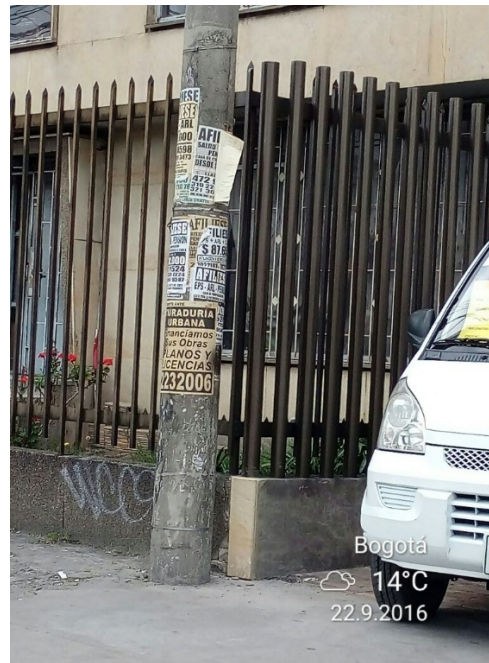
Fotografías No. 1 y 2. Elementos instalados en Espacio Público (Mobiliario Urbano). Visita de oficio en la Localidad de Teusaquillo, el día 22 de Septiembre de 2016. No. Afiches: 2.