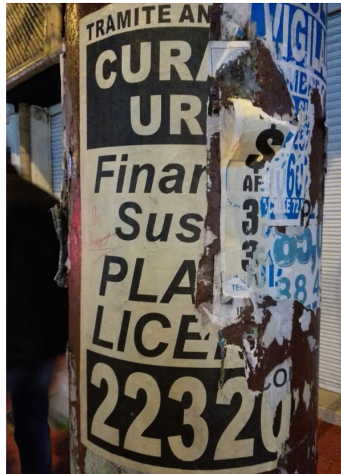
Fotografías No. 3 y 4. Elementos instalados en Espacio Público (Mobiliario Urbano). Visita de oficio en la Localidad de Engativá, el día 22 de Septiembre de 2016. No. Afiches: 2.