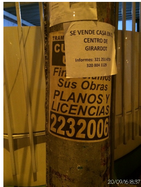
Fotografías No. 8 y 9. Elementos instalados en Espacio Público (Mobiliario Urbano). Visita de oficio en la Localidad de Engativá, el día 20 de Septiembre de 2016. No. Afiches: 2.