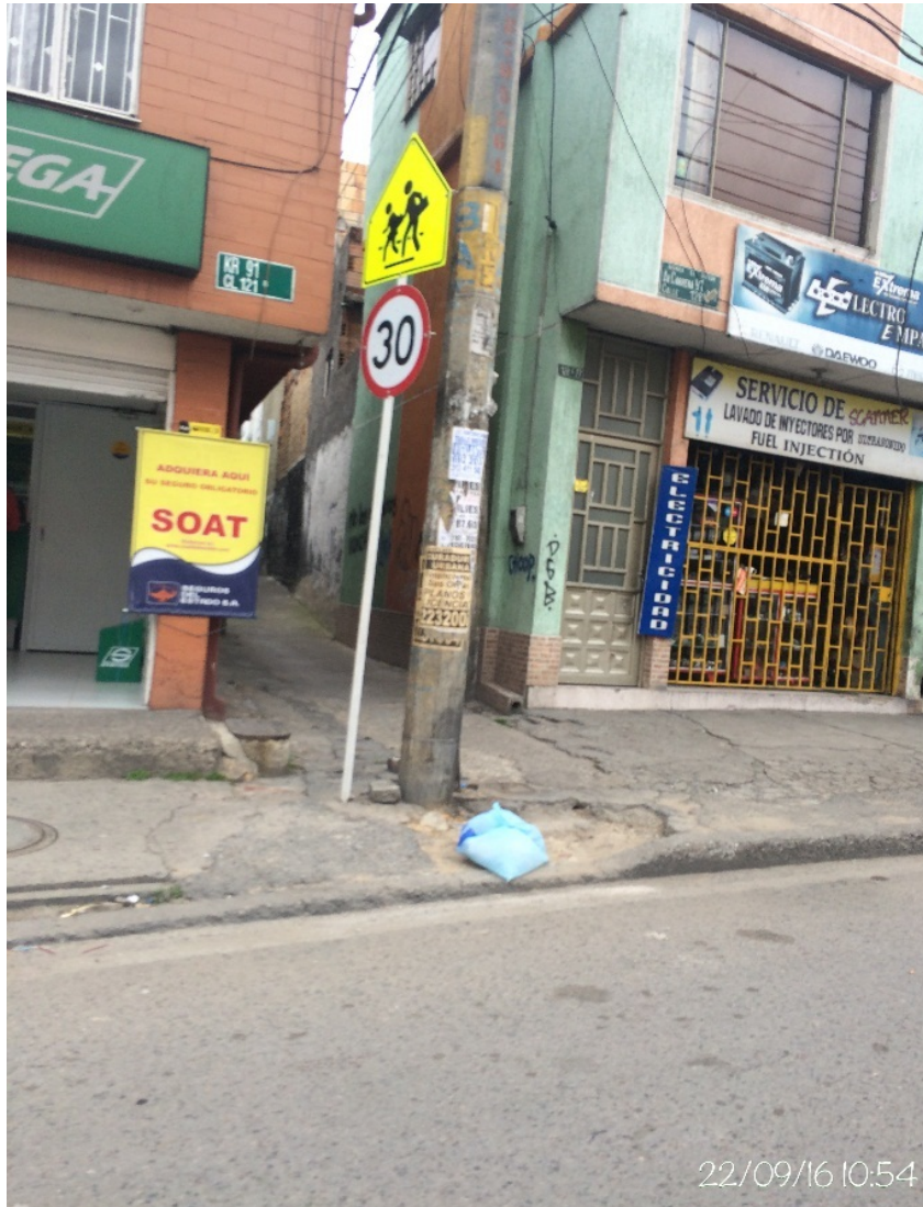
Fotografía No. 17. Elemento instalado en Espacio Público (Mobiliario Urbano). Visita de oficio en la Localidad de Suba, el día 22 de Septiembre de 2016. No. Afiches: 1.